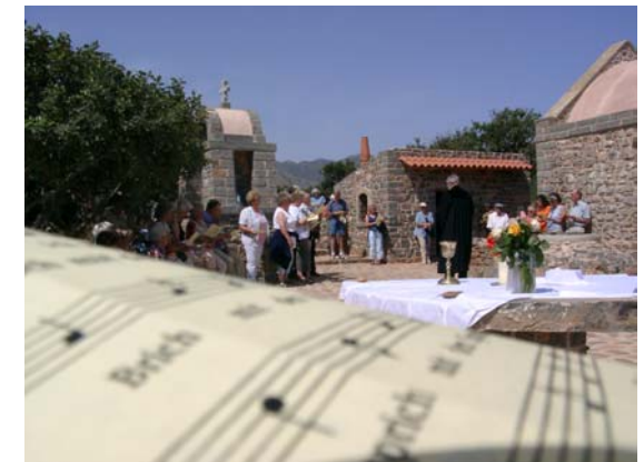
Andacht mit einer Reisegruppe bei Elounda