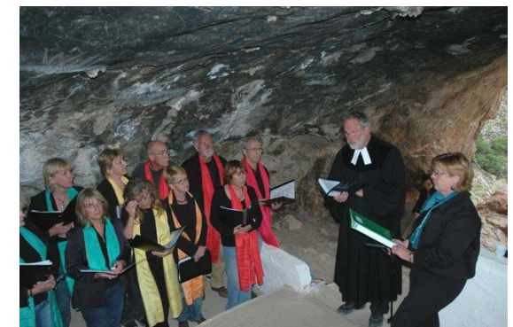
Chorandacht in der Höhle von Milatos