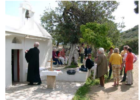
Ostergottesdienst in Gournia, Ost-Kreta