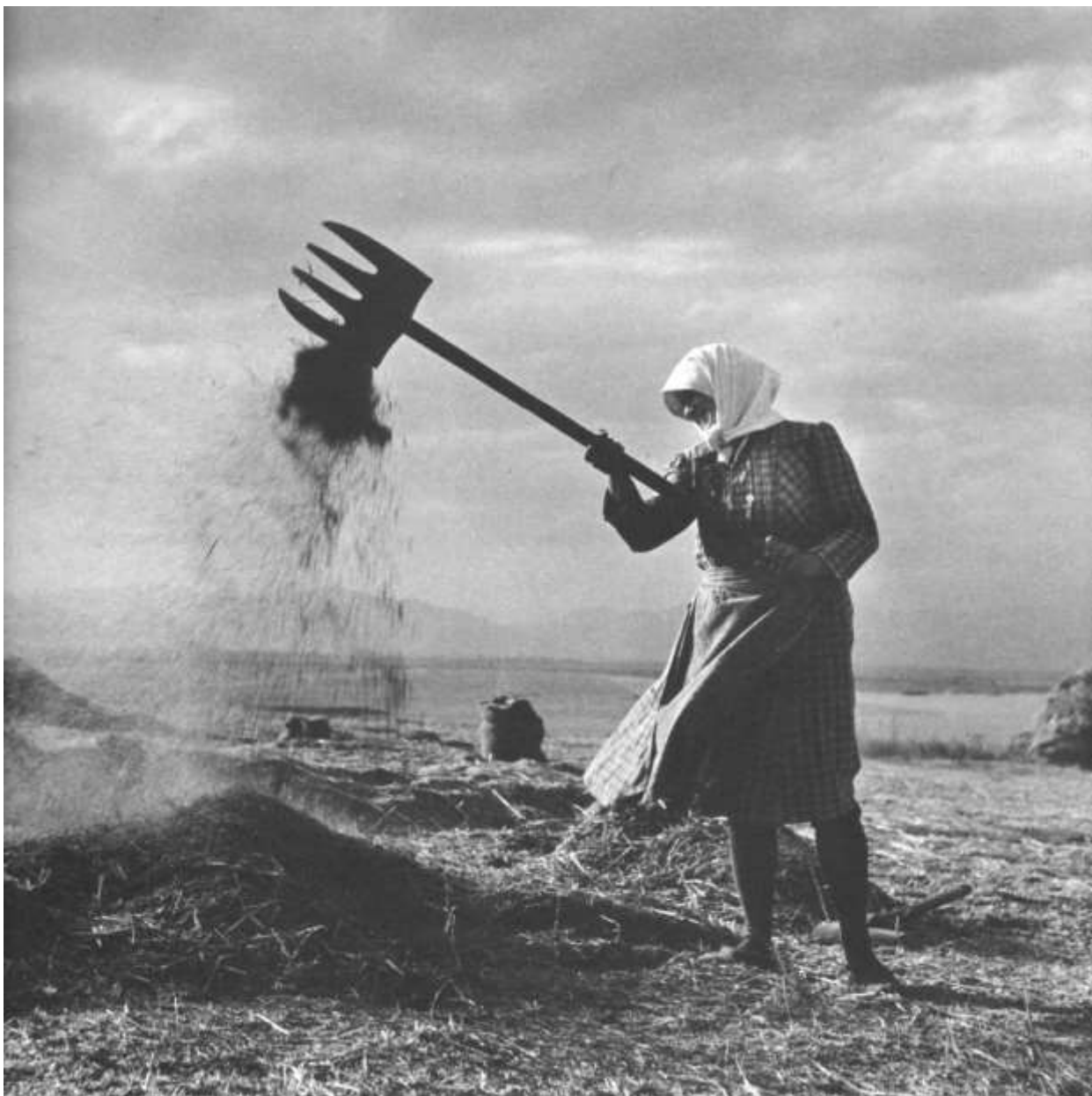
Abb. 1: Worfeln, Festland Anfang 20. Jhdt., aus: Theocharis, D. „Neolithic Greece“, Athen 1973.

Wer geglaubt hat, dass Getreide nach dem Dreschen fertig zum Mahlen und Backen ist, der täuscht sich. Auf dem Weg vom reifen Getreide zum Brot mussten die Bauern, vor allem die Frauen, bis vor einigen Jahren noch viel Zeit mit dem Erntegut verbringen, bis es bereit zum Backen war. Dieser Prozess, den es in Kreta noch in den 60er Jahren gab, ist repräsentativ für die Aufgaben, die früher in ganz Europa zur Getreideverarbeitung gehörten.