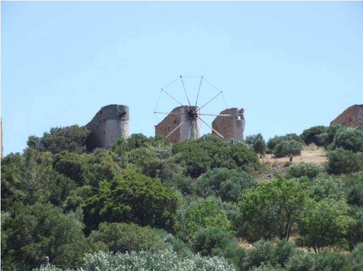
Abb. 2: Windmühlenreihe (nur eine ist funktionstüchtig erhalten), Lakonia

Weil fließendes Wasser so rar ist, kamen Wassermühlen in Kreta nur selten vor. Sie waren immer an steilen Hängen angelegt, mit einem hohen, wie ein Kamin aussehenden Wasserzulauf, durch den auch kleine Wassermengen beim Fall durch ein leicht trichterförmiges hohes Rohr genügend Kraft erzeugen konnten, um das ganz unten angebrachte Mühlrad zu drehen. Aus dem unteren, mit einem Bogen in die Waagerechte führenden Ende des Rohres sprühte das Wasser im untersten Geschoss des Gebäudes auf das waagrecht liegende, sich mitsamt seiner senkrechten Achse drehende Mühlrad. Diese Achse reichte hinauf in die darüber liegende Mahlstube und drehte dort den oberen der zwei Mühlsteine.