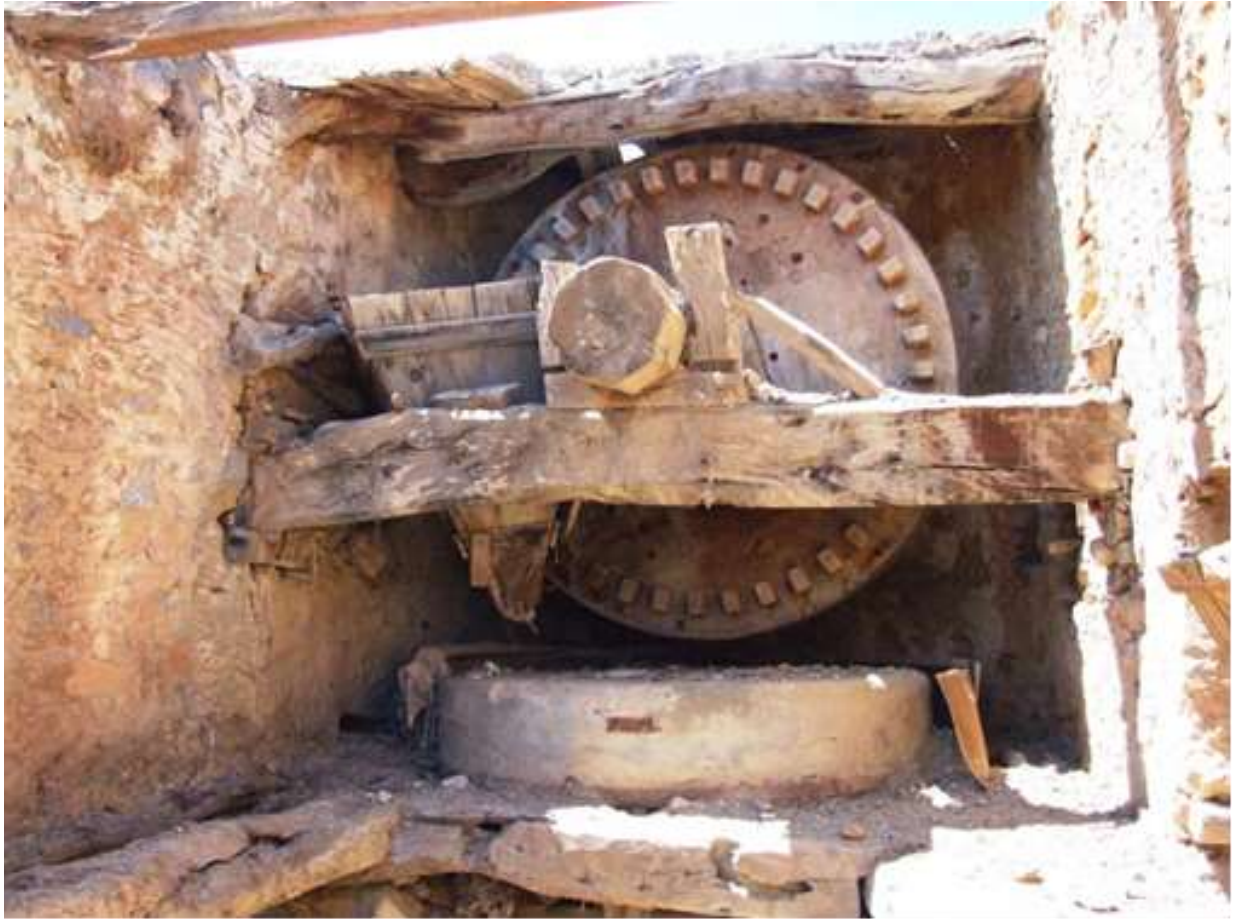
Abb. 3: Windmühle – Mechanismus innen

Wenn die Familien Mehl brauchten, brachten sie ihr Getreide gewöhnlich in Ladungen zwischen 80 und 90 kg auf Eseln oder Maultieren zur Mühle. Der Müller mahlte das Mehl entweder für einen Lohn oder zwei bis drei Prozent des Getreides. Das Mahlen fand immer kurz vor dem Backen statt, da das (Vollkorn-) Mehl schnell oxidierte (Mehl aus vorher entkeimtem Getreide hält sich länger, ist aber eine moderne Erfindung). Von der Größe und den Bedürfnissen der jeweiligen Familien hing es ab, wie viel und wie oft Brot gebacken wurde. Das traditionelle kretische Brot ist eine Art Dauerbrot oder Zwieback, das Paximadi (παξιμάδι), in runder Form Kouloura (κουλούρα), oder auf Kretisch Dako (δάκο) heißt. Weil es trocken ist, kann es für lange Zeit gelagert werden, eine wichtige Eigenschaft, denn viele kretische Männer waren Schäfer oder Seeleute, die selten nach Hause kamen. Dako ist viel leichter zu tragen als frisches Brot und hält sich viel länger. Vor dem Essen wird es kurz in Wasser getaucht und schmeckt kurz darauf wie frisches Brot.